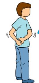
Estiramiento global en torsión por tramos (columna cervical)